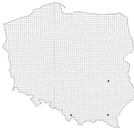
Ryc. 2. Stanowiska Chrysolina eurina w Polsce; niebieski – stanowiska literaturowe; czerwony – nowe stanowisko.