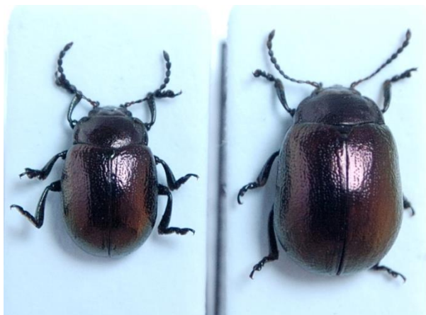
Ryc. 1. Chrysolina eurina (Frivaldszky, 1883). Z lewej – samiec, z prawej – samica.

W Polsce pierwsza obserwacja gatunku pochodzi z 2007 roku z Humnisk (UTM: EA70) w Beskidzie Wschodnim (Twardy i Borowiec 2012). Drugie stwierdzenie miało miejsce w Rąblowie (kod UTM: EB78) na Wyżynie Lubelskiej (Ścibior 2015). Trzecie ponownie dotyczy Beskidu Wschodniego, gdzie w miejscowości Brzozów-Podlesie (UTM: EA70) zebrano ogółem dwanaście osobników na wrotyczach i w ściółce pod nimi w okresie od 22.09. do 17.10.2016 roku (Twardy 2017) (Ryc. 2).