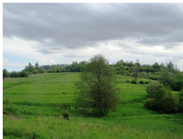
Ryc. 3. Widok ogólny siedliska gatunku, wzgórze Grojec.