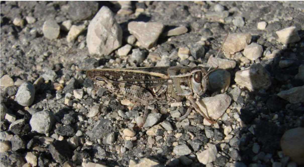
Fot. 1. Nadobnik włoski Calliptamus italicus na stanowisku w Górażdżach. Phot. 1. Italian locust Calliptamus italicus from the Górażdże quarry.