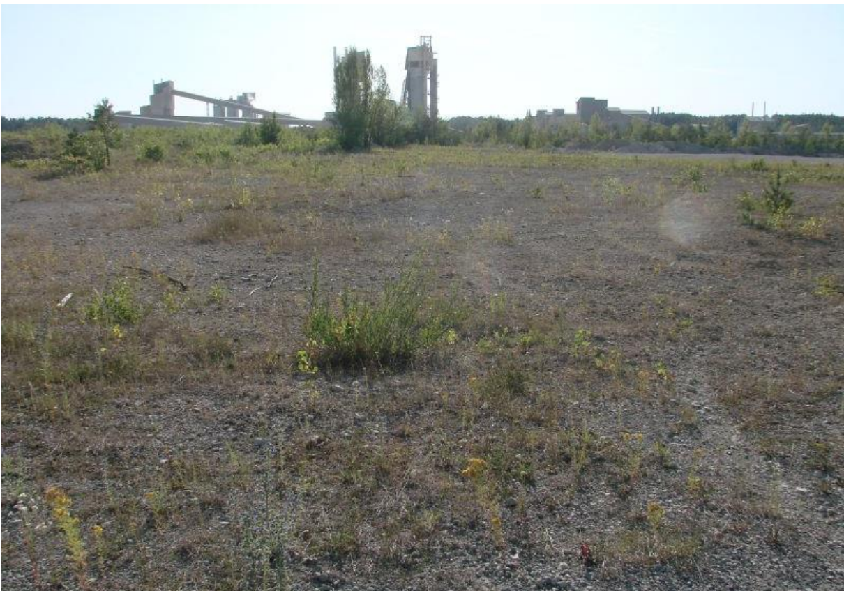
Fot. 2. Siedlisko zasiedlane przez nadobnika włoskiego Calliptamus italicus w Górażdżach. Phot. 2. The habitat of the Calliptamus italicus in Górażdże.