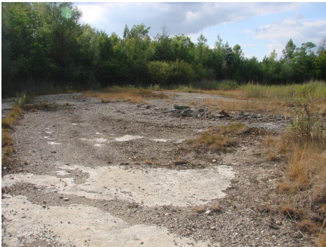
Ryc. 1. Stanowisko odłowienia Leptopus marmoratus w Górażdżach. Fig 1. Collecting site of Leptopus marmoratus in Górażdże.