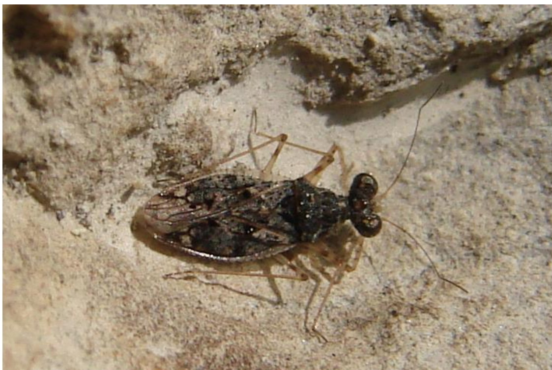
Ryc. 2. Leptopus marmoratus na stanowisku w Górażdżach. Fig 2. Leptopus marmoratus from the Górażdże quarry.